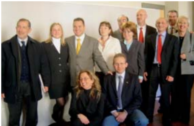
I collaboratori di Legacoop che hanno contribuito alla riuscita dell'assemblea.

Sede via Masaccio 2/4 Como tel. 031.507180 e-mail ccscomo@tin.it