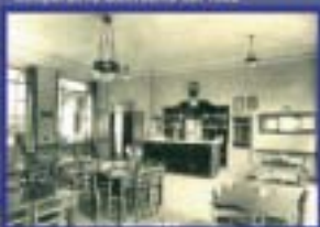
Cooperativa Multiservizi del 1902