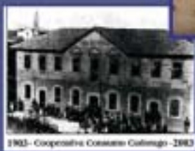
1903 - Cooperativa Comasco Galleggio - 1903