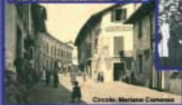
Circolo Mariano Comense

lineare. Ci sono stati errori, fallimenti, tentativi mal riusciti. Ci fu l'ostilità delle classi dirigenti liberali all'inizio, poi l'aperta avversione del fascismo, prima con la violenza delle squadre armate poi con le leggi che liquidarono l'autonomia del movimento cooperativo. La riconquistata libertà con la Re-