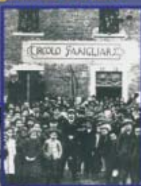
Circolo Sangiarazi di Cernusco di Valpurga nel 1912