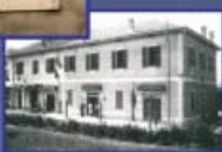
Cooperativa di Consumo di Belgio del 1905